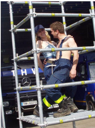
Variante des GoGo-Käfigs mit Pärchenbesetzung . (Abb. Y / 3)