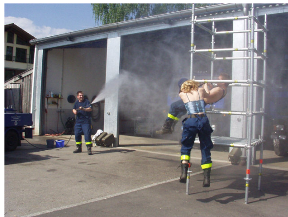
Erfolgreicher Ausbruch der Animateure nach Zufuhr temperaturregulierender Nebel. (Abb. Y / 4)