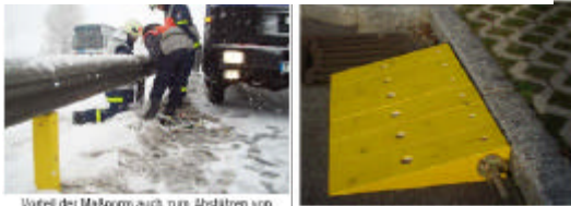
Vorteil der Maßnorm auch zum Abstützen von Leisplankes (50 cm leichte Weite)